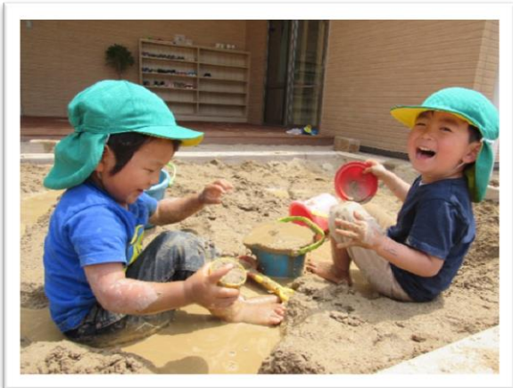
どろんこ たのしい