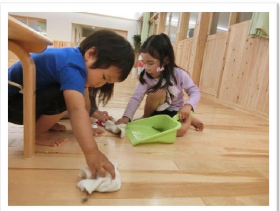
皮むきの後は、きれいにしなくちゃね・・・