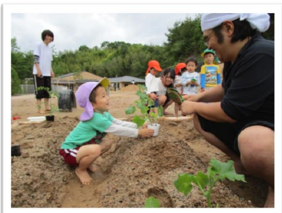
きゅうり、トマト、ピーマン 大きくなあれ