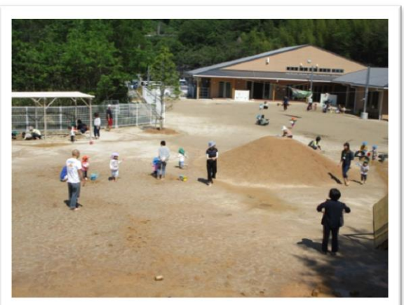
広～い園庭と広～い園舎で、ゆっくりゆったり