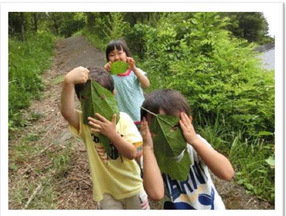
裏山散歩 大きな葉っぱ、見つけたよ～